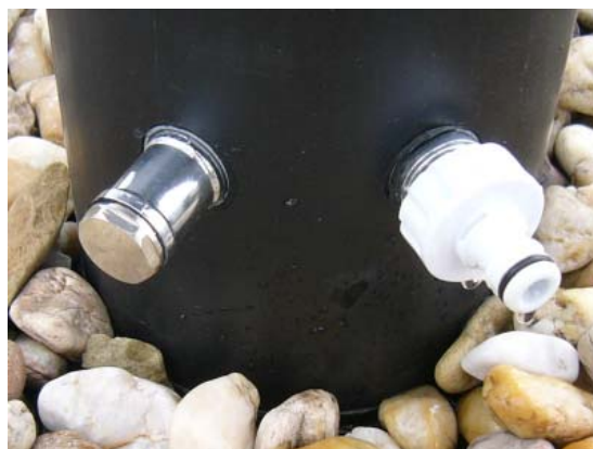
výpustný otvor se zátkou (vlevo) vstupní armatura s hadicovou koncovkou (vpravo)