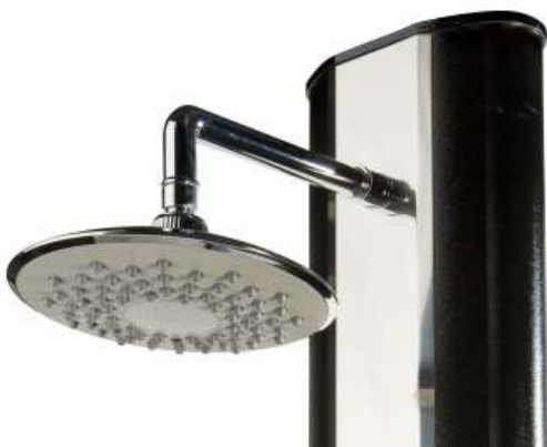
sprchová ružica – detail montáže v hornej časti sprchového telesa

Pred uvedením do prevádzky opatrne odstráňte ochrannú fóliu z ozdobného nerezového krytu sprchy!