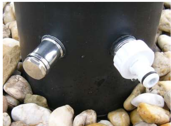
výpustný otvor se zátkou (vlevo) vstupní armatura s hadicovou koncovkou (vpravo)